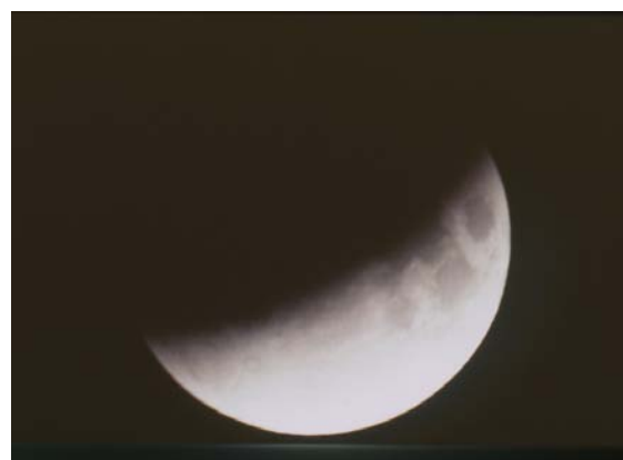
L'éclipse totale du 9 novembre 2003.