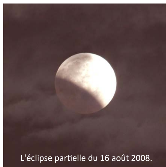
L'éclipse partielle du 16 août 2008.