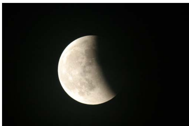
L'éclipse totale du 15 juin 2011.