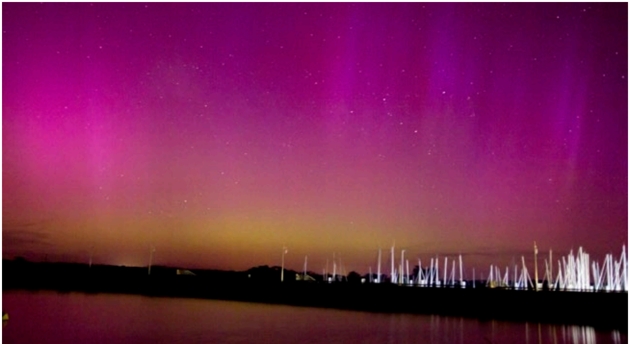
Fig.1. L'aurore boréale du 10 mai 2024 photographiée depuis l'Île de Ré (photo Xavier Plouchard, animateur scientifique, Muséum d'histoire naturelle de La Rochelle. Pose 4 s 800 ISO Focale de 20 mm ouvert à 2).

éruptions et d'éjections de matière solaire est parvenue jusqu'à la Terre, provoquant l'orage géomagnétique le plus intense depuis 2003. Cela valait bien un court article, même au débotté.