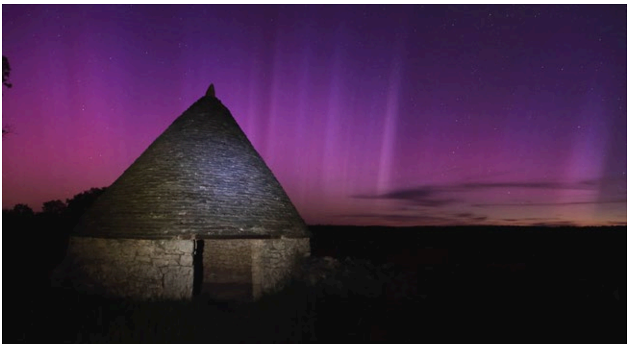
Fig.2. Cazelle de Nouvelle (Lot) 4 h, 11 mai pose 2 s 5 000 ISO (Raphaël Melac).