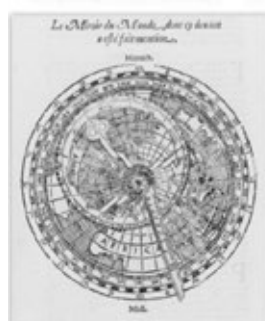
Cosmographie, Pierre Apian, 1581

À titre d'exemple, voici l'une de ces anciennes volvelles présentes dans l'ouvrage de Pierre Apian et reconvertie en cette interprétation actuelle de Pierre Causeret :