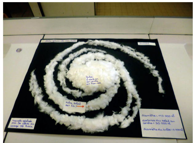
Fig.4. Maquette de la Galaxie.

Les élèves ont pour consigne de réaliser une maquette sur une feuille noire de 50 cm par 60 cm. Après avoir trouvé l'échelle (ici 1 cm pour 2 000 a.l.), ils esquissent la spirale au crayon gris à partir de représentations trouvées sur le Web. La place du Soleil est aussi indiquée. Ils construisent la Galaxie à l'aide de coton, le Soleil est matérialisé par une épingle jaune. Le Système solaire n'est bien sûr pas visible à cette échelle puisqu'il ferait environ 0,05 mm et l'épingle utilisée est trop grosse pour le matérialiser.