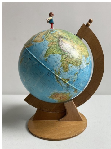
(b) support pour un globe terrestre.