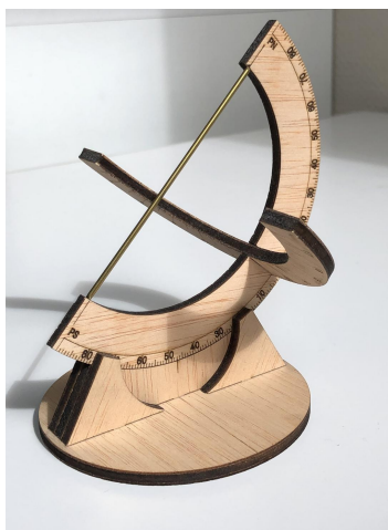
(a) le cadran solaire équatorial universel.