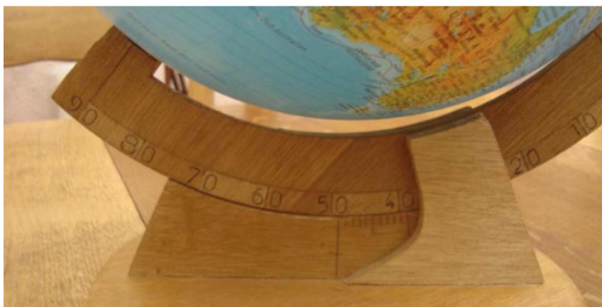
FIG. 5 – Le cadran solaire agrandi et adapté sur un globe terrestre.

Les plans du cadran solaire équatorial universel, excepté l'équateur, peuvent être utilisés pour fabriquer la maquette du globe terrestre.