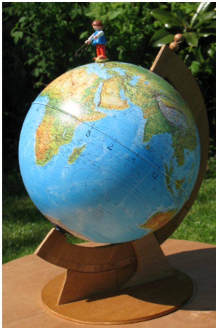
FIG. 6 – Dans les Cahiers Clairaut n° 134 (été 2011) sur les cadrans solaires, l'article « Le cadran sphère » développe l'utilisation de cette maquette.

Il faut alors partir du diamètre du globe terrestre pour avoir le diamètre intérieur du demi-méridien et ainsi avoir le coefficient de proportionnalité pour passer de l'échelle du cadran solaire à celle de la maquette du globe terrestre.