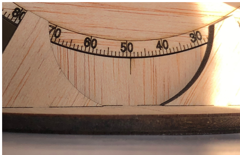
FIG. 4 – Réglage du cadran solaire en latitude : ici 49^\circ nord.