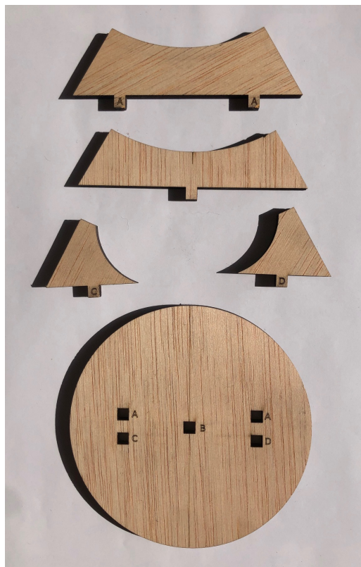
(a) Les pièces du socle.

Pour constituer le socle, emboîter les ergots des 4 pièces dans les trous carrés du socle, selon la FIG. 3. Des repères A, B, C, D font correspondre les ergots à leurs trous respectifs.