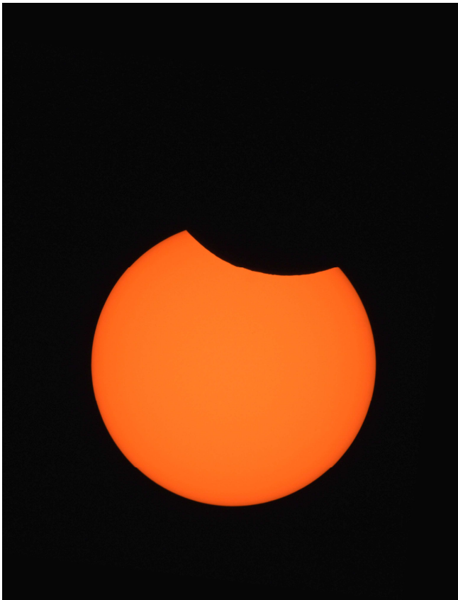
Le Soleil photographié depuis Esbarres (21) à 10 h 20 TU

Diamètre apparent de la Lune le 10 juin : 30'