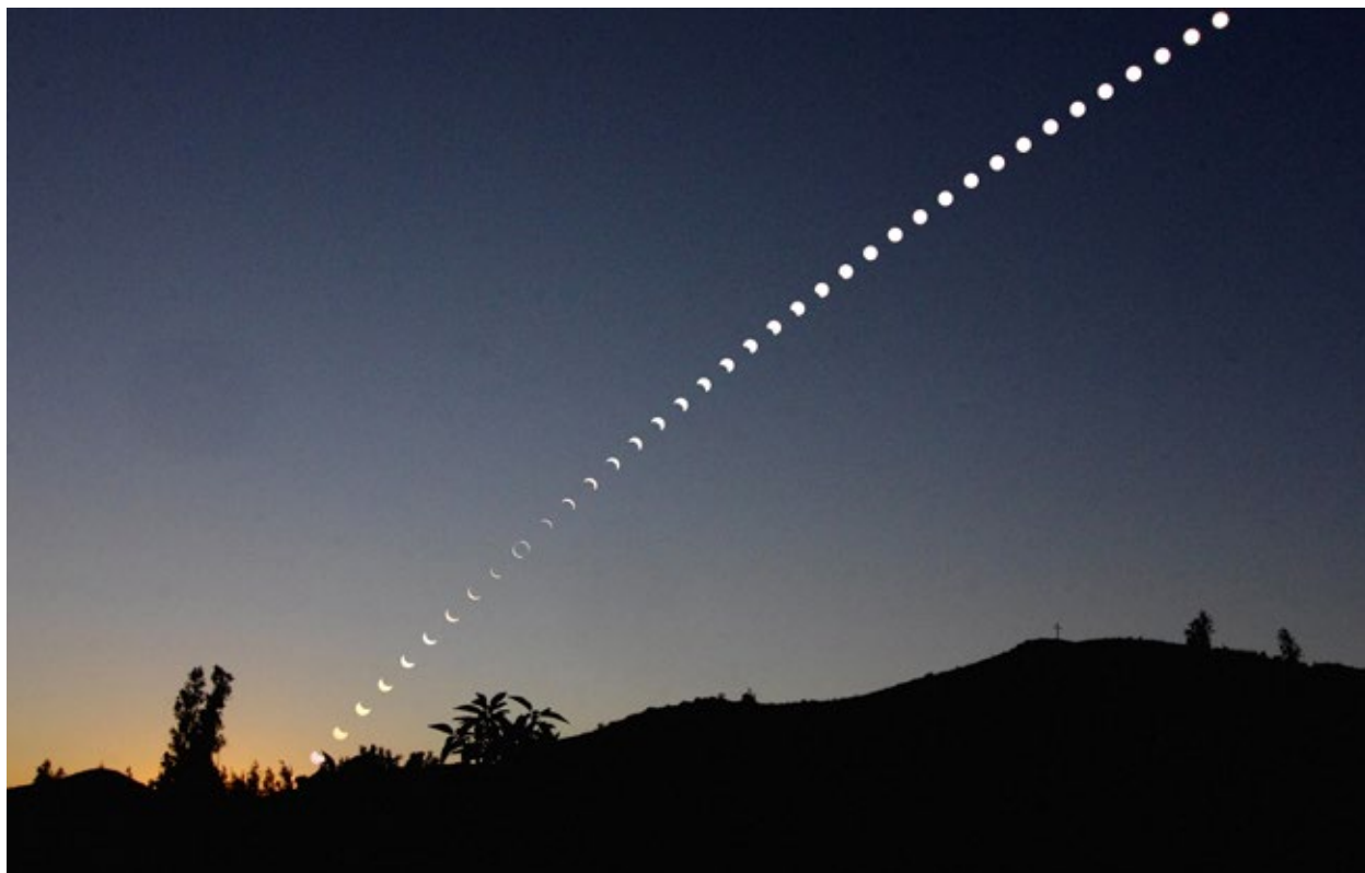
Chapelet réalisé lors de l'éclipse de Soleil du 2 juillet 2019 par Michel Vignand (La Réunion).