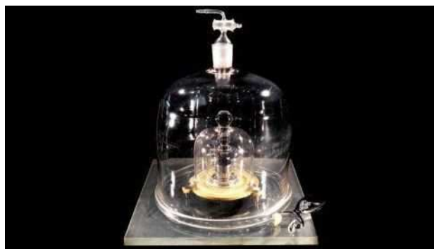
Fig.2. Photo d'une des copies du prototype international du kilogramme, déposé au BIPM.

Avec la seconde dite « des astronomes », ces trois unités forment le système d'unités mécaniques MKS. Le mètre et le kilogramme sont définis respectivement comme la longueur et la masse des deux prototypes internationaux, tandis que la seconde est « la fraction 1/86 400 du jour solaire moyen ».