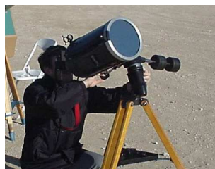
et avec un filtre pleine ouverture