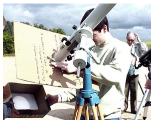
Observation par projection

Tout le monde a constaté que le Soleil était déjà éblouissant à l'œil nu, il faut donc faire encore plus attention dès que l'on amplifie la lumière avec un dispositif optique ! Deux solutions : l'observation par projection ou bien à l'aide d'un filtre s'adaptant à l'avant de l'instrument. Il existe maintenant des filtres de verre de bonne qualité et de prix raisonnables fabriqués dans les diamètres courants. Il ne faut pas utiliser les filtres "sun" à visser sur l'oculaire qui peuvent se fendre sous l'effet de la chaleur. Le système par projection se prête bien à l'observation collective, il est prudent de neutraliser le chercheur de l'instrument en lui posant son bouchon d'objectif afin d'éviter toute distraction... ; penser aussi au Solarscope, qui a fait l'objet d'un article dans le n°123 des Cahiers Clairaut.